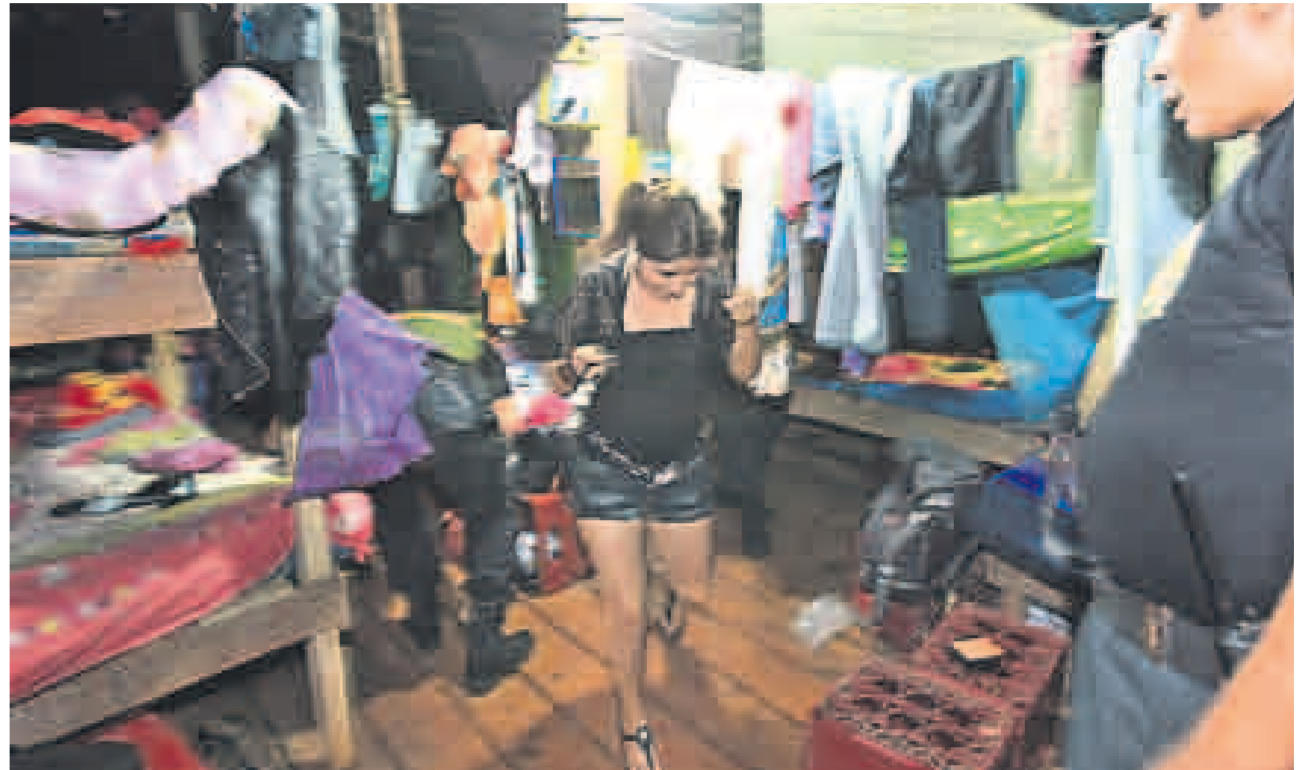
ENGAÑADAS. Las menores son llevadas con mentiras a los campamentos mineros. Viven hacinadas, les quitan sus DNI y sus celulares.