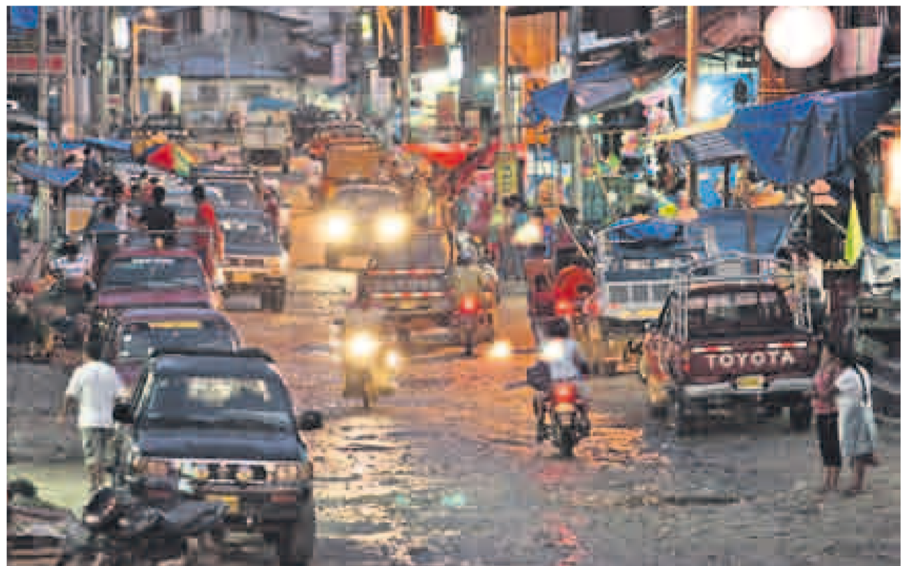
CAOS. Huepetuhe es distrito desde 1994, pero nada se ha hecho desde entonces y la minería sepulta la zona urbana.