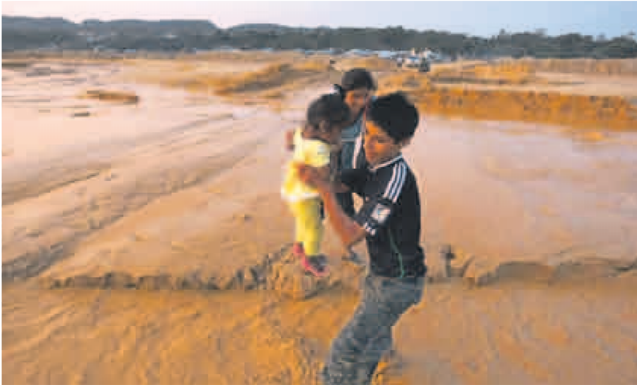
VULNERABLES. Los relaves de la minería informal amenazan la salud de los niños de Madre de Dios. Han inundado casas y colegios.