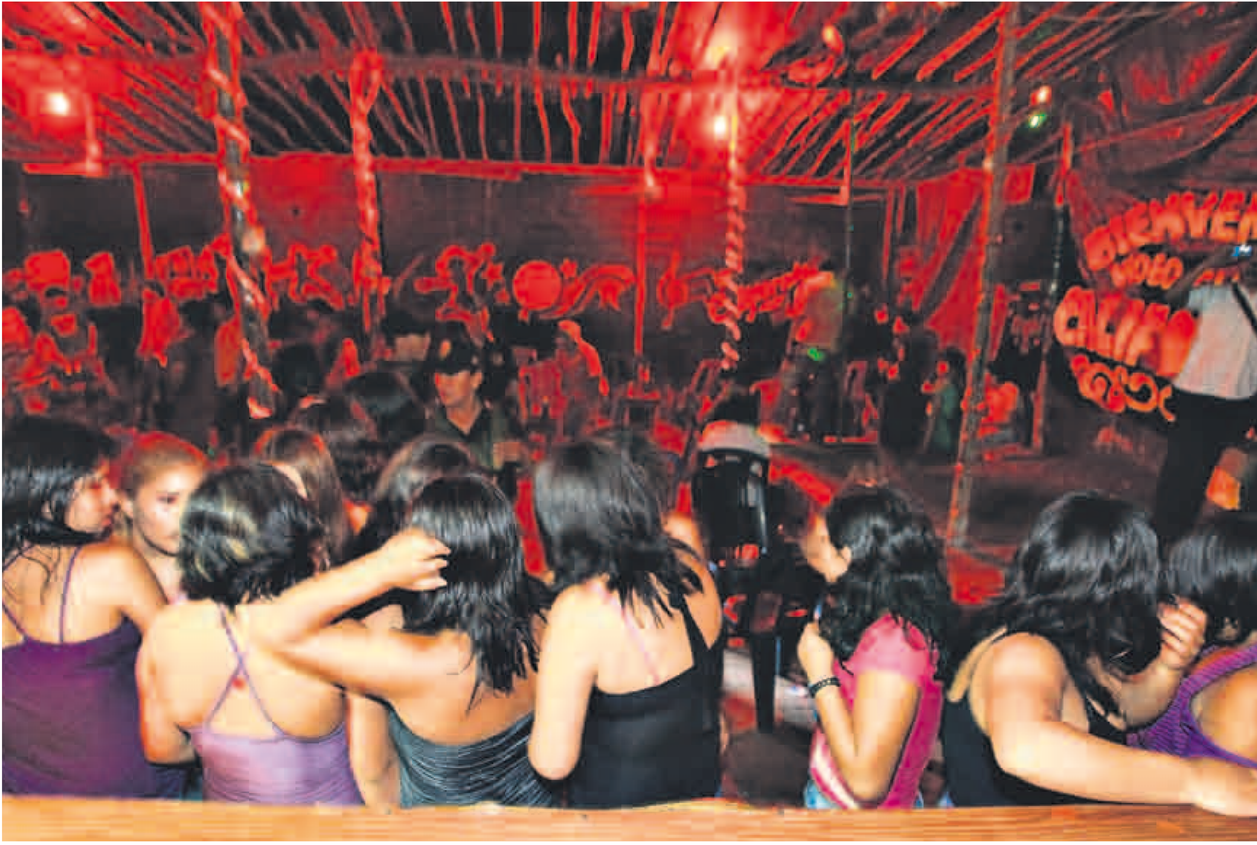
VICTIMAS. La mayoría de adolescentes proviene de Cusco, Puno, y en menor medida de Lima, Tacna y Ucayali. Solo en lo que va del año la policía ha rescatado de burdeles clandestinos con fachada de bares a 183 menores, más del doble que en todo el 2010.

Existe una evidente falta de control en relación al combustible en las zonas mineras, hecho que potencia aún más la extracción de oro informal. A lo largo de las vías de acceso a distritos como Huepetuhe se ven centros de abastecimiento improvisados, los cuales muchas veces no cuentan con sus papeles y permisos en regla.