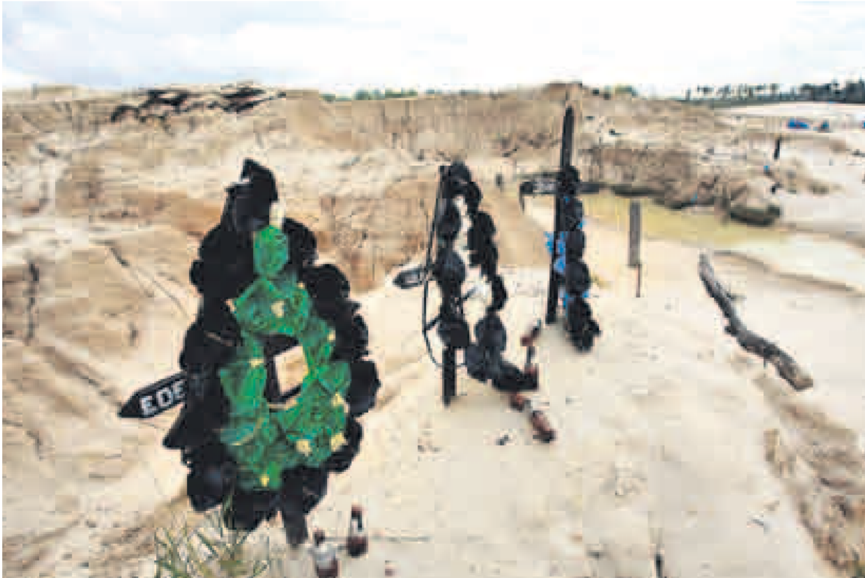
EL ESLABÓN MÁS DÉBIL. En los campamentos mineros todos los días se vulneran los derechos laborales. Cada semana trabajadores mueren sepultados por las toneladas de tierra que se remueven o ahogados en los pozos de agua.

El hacinamiento, la promiscuidad y el alto consumo de licor han desencadenado otra bomba de tiempo: los distritos de Inambari y Huepetuhe tienen las tasas de VIH más altas de todo el país